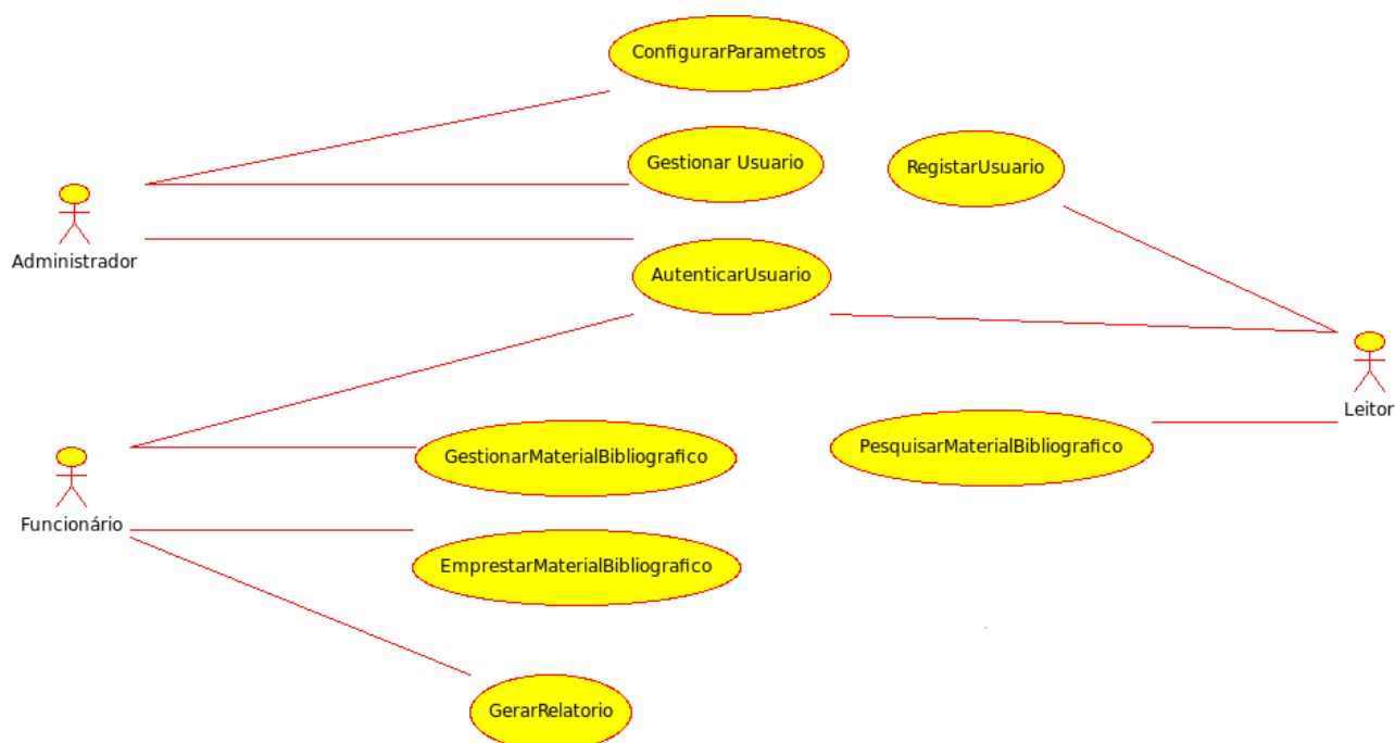
Figura # 1. Diagrama de casos de uso do Sistema Gestão de Biblioteca